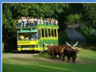
Zoo Dvur Kralove Safaribus