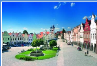
Telcz - Rynek