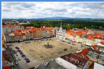
Czeskie Budziejowice - Rynek