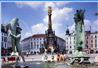
Ołomuniec – Kolumna Świętej Trójcy