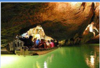
Jaskinia Punkevní - rejs