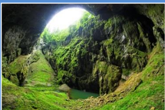
Morawski Kras – Przepaść Macocha