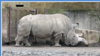
Zoo Dvur Kralove - Nosorożec biały północny