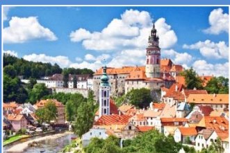
Czeski Krumlov - Zamek