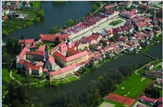
Telcz – z lotu ptaka