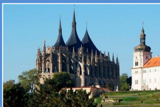
Kutna Hora – Kościół św. Barbary