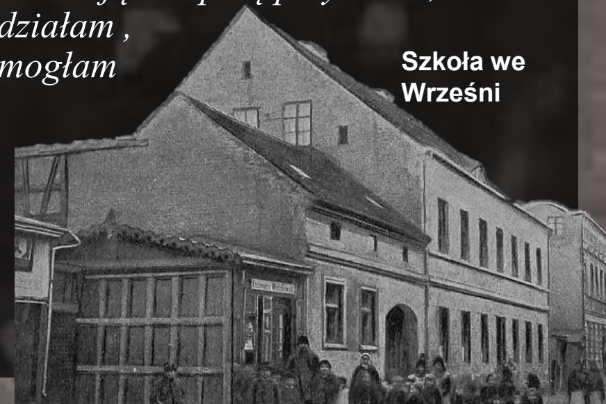
Szkoła we Wrześni

Podczas procesu gnieźnieńskiego na kary pozbawienia wolności od 2 miesięcy do 2,5 roku skazano 25 osób. Pomimo tego wyroku, na wzór dzieci z Wrześni strajk rozpoczęły także inne szkoły.