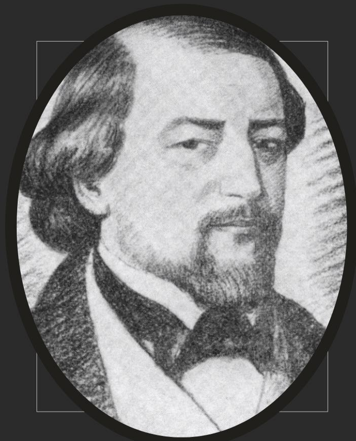
JAN TYSSOWSKI, DYKTATOR POWSTANIA

Nie wiedząc o rozpoczętej kilka dni wcześniej rzezi galicyjskiej, w nocy z 21/22 lutego rozpoczęło powstanie pod dyktatorstwem Jana Tyssowskiego. Dembowski formalnie pełnił funkcję sekretarza dyktatora, a jego głównym zadaniem było propagowanie powstania najniższym warstwom społecznym na obrzeżach Krakowa. W praktyce jednak stał się faktycznym przywódcą ruchu. Po przybyciu do Krakowa 24 lutego błyskawicznie zajął miasto i zwerbował oddział ochotników.